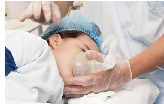
Figure 1 Niño recibiendo anestesia.