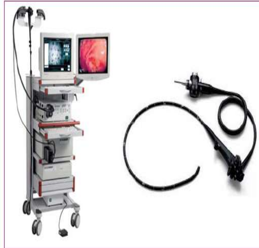
Figure 1 Imagen de la torre de video endoscopia y de endoscopio

Introduciendo este tubo flexible por la boca, cuando se realiza una Endoscopia Alta o Panendoscopia oral o por el ano si se trata de una Colonoscopia.